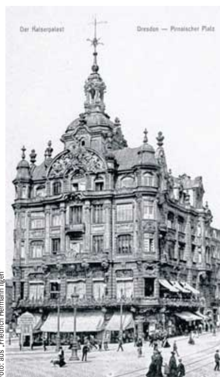
Nur eine der vielen Immobilien, die Ilgen sein eigen nannte: der Kaiserpalast.

Erhältlich ist das Buch in Dresden nur in der Buchhandlung Dresden Buch im Untergeschoss der QF Passage an der Frauenkirche.