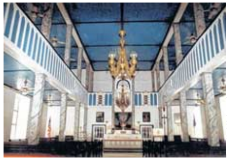
Blick ins Innere der lutherischen Kirche St. Paul in Serbin.